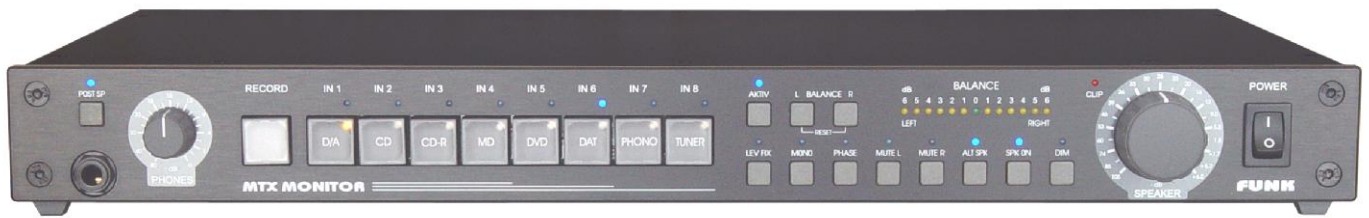
MTX-Monitor.V3a HiFi-Version schwarz