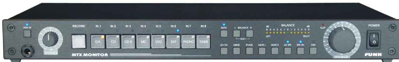
MTX-MONITOR.V3b-2, HiFi-Version schwarz