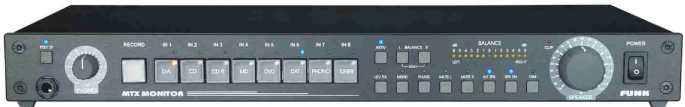
MTX-MONITOR.V3b-4, HiFi-Version schwarz