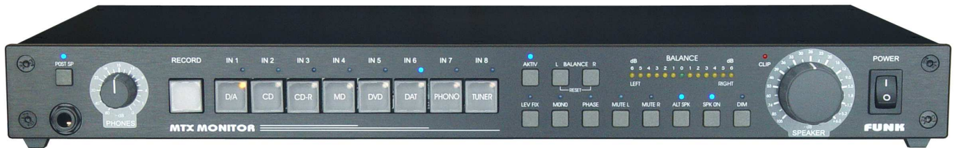
MTX-MONITOR V3b-4.3.8 HiFi-Version schwarz